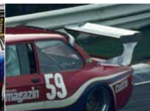
Beleg für anderen Flügel

Allerdings kann ein Vorbildfoto durchaus hilfreich sein, wenn es darum geht, vom Bausatz abweichende Karosserievarianten zu belegen – so diese denn den restlichen Regeln entsprechen und den Aspekt des „Augenmaßes“ berücksichtigen.