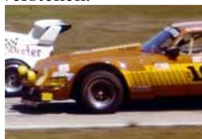
Trotz Fotonachweis nicht erwünscht !

Vorbildfotos sind nicht geeignet, die Zulassung bestimmter Modelle zum Rennen zu erreichen (im Sinne von „erzwingen“ !), wenn damit Bestimmungen, welche in diesem Dokument aufgeführt sind, ausgehebelt bzw. ad absurdum geführt werden. Denn speziell in Großbritannien und den USA haben teilweise recht merkwürdige Fahrzeuge im Rahmen der freizügigen Gruppe 5 (bzw. IMSA) an Rennen teilgenommen – welche jedoch nichts mehr mit dem zu tun haben, was die Veranstalter unter Gruppe 2 4 5 verstehen.