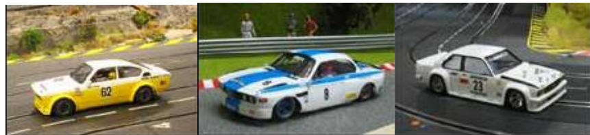
Beispiele für Fahrzeuge mit GfK- und Resine-Bodys