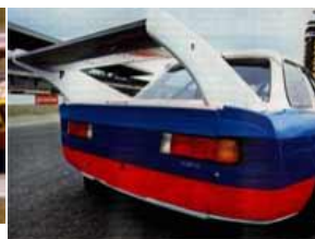
Wie Tamiya 320 turbo